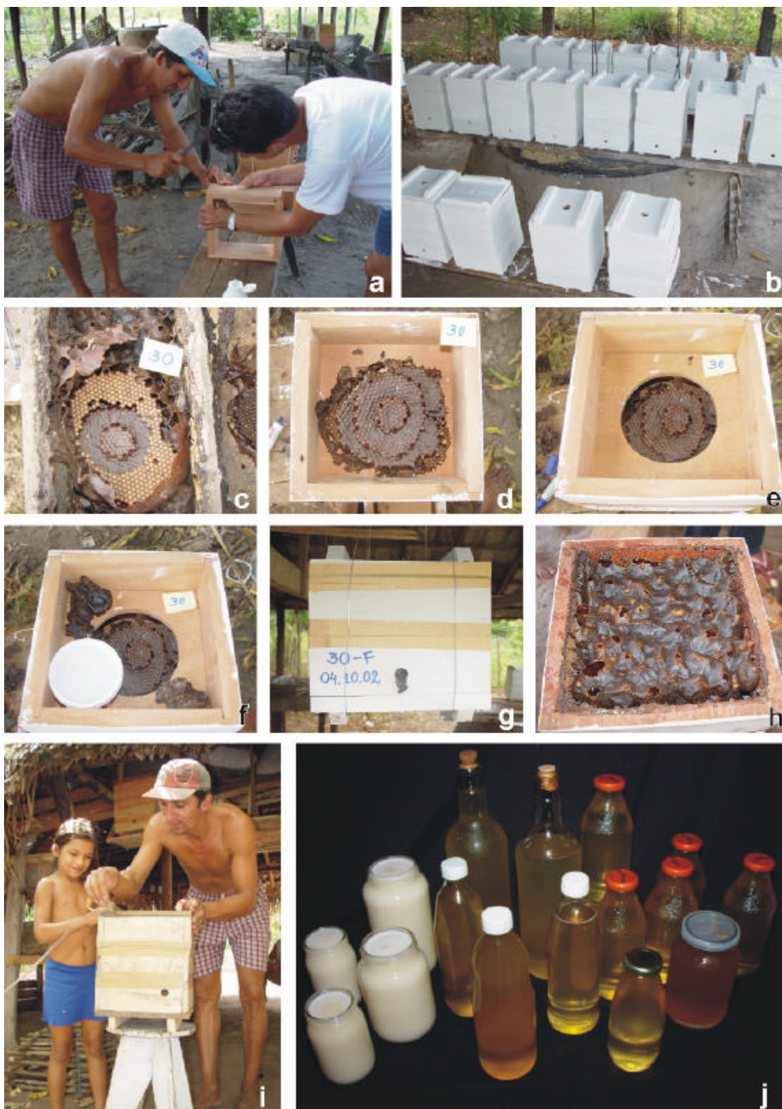
Figura 1. Transferência para caixa racional. a) montagem das caixas; b) caixas prontas, c) ninho em caixa cabocla; d) favos de cria no ninho; e) sobreninho colocado; f) sobreninho com alimentador, g) nova caixa no local definitivo: observar que nesta fase ainda não são colocadas as melgueiras, h) melgueira totalmente preenchida com potes de mel, i) a meliponicultura é de fácil assimilação pelos agricultores, e j) méis de abelhas indígenas: quando produzido de forma racional e acondicionado corretamente, resulta em um produto de excelente qualidade, alto valor nutricional e econômico.